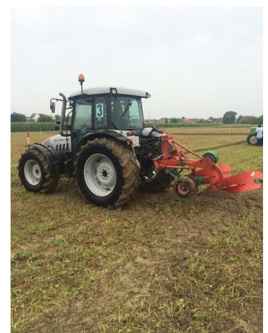
Zagorju mnogo teža nego u nekim ravničarskim dijelovima.

- Obrada zemlje je za svaku zemlju značajna, pa tako i za Hrvatsku. Zbog konfiguracije terena, ona je u