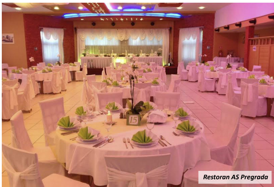
Restoran AS Pregrada