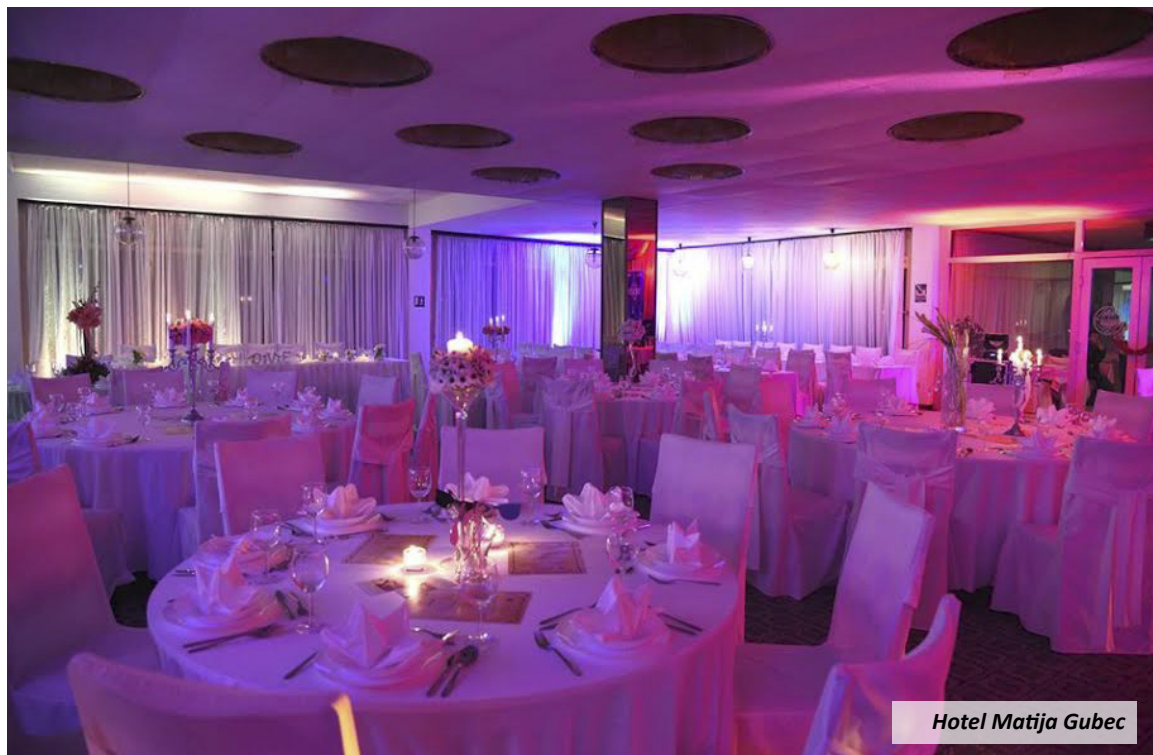
Hotel Matija Gubec

U Termama Jezerčica osoblje sa zadovoljstvom može osmisлити poseban jelovnik prema željama gosta. Kao dodatne usluge nude svadbene kolače po izboru glavne slastičarke, svadbenu tortu te pakete pića neograničene konzumacije. Uz sve