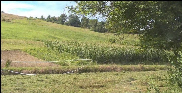
Policija zaustavlja KZZ

policijskog očevida, pronađene ljudske kosti je mrtvozornica poslala na Zavod za sudsku medicinu i kriminalistiku Medicinskog fakulteta u Zagrebu, gdje će se pokušati utvrditi starost kostiju i identitet. (mlm) ■