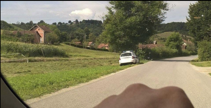
Policija zaustavlja KZZ

U Globočecu u općini Marija Bistrica, u zaseoku Kovačići, 69-godišnjak je policiji dojavio kako je u koritu potoka pronašao ljudske kosti i to samo kosti lubanje i prsišta, dok ostaci drugih dijelova tijela nisu pronađeni. Nakon obavljenog