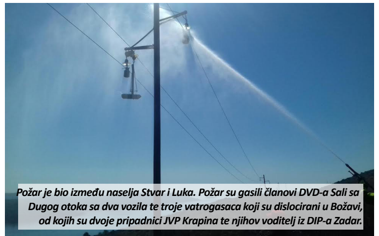
Požar je bio između naselja Stvar i Luka. Požar su gasili članovi DVD-a Sali sa Dugog otoka sa dva vozila te troje vatrogasaca koji su dislocirani u Božavi, od kojih su dvoje pripadnici JVP Krapina te njihov voditelj iz DIP-a Zadar.

- Odgovornost za sigurnost mještana i turista, za naše vatrogasce je velika. Uz njih na toj lokaciji još su tri sezonska vatrogasca iz redova mještana te voditelj dislokacije iz sastava Državne vatrogasne intervencijske postrojbe iz baze u Zadru. Naši vatrogasci dežuraju u smjenama po dvojica, a smjena je u trajanju od 14 dana. Vozila s kojima dežuraju su također iz Krapinsko - zagorske županije. Tu je navalno vozilo s alatom za tehničke