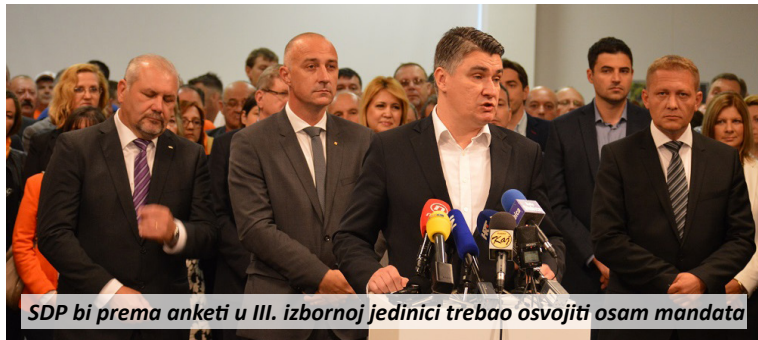
SDP bi prema anketi u III. izbornoj jedinici trebao osvojiti osam mandata

Ovaj put SDP je procijenio da im Laburisti ne trebaju, a u njihovu je koaliciju ušao HSS, koji je na prošlim izborima bio u koaliciji s HDZ-om. Rezultati ankete pokazuju i da je Živi zid blizu izbornog praga sa 4,6 posto. (ab) ■