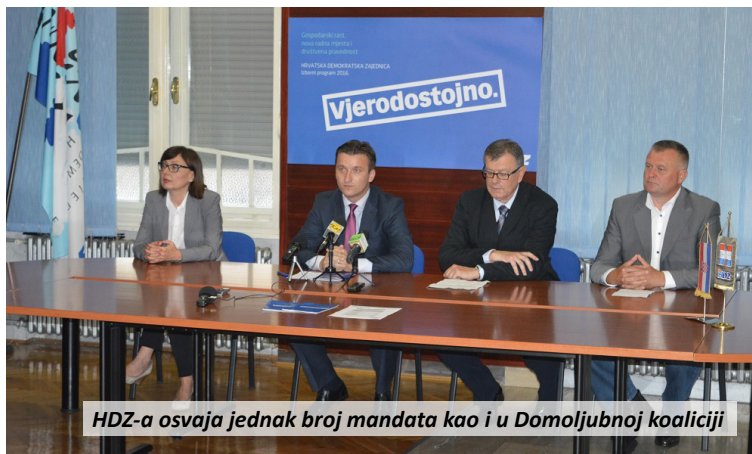
HDZ-a osvaja jednak broj mandata kao i u Domoljubnoj koaliciji

Narodna koalicija prema anketi tako uživa podršku 42 posto birača, HDZ 16,3 posto, Bandićeva koalicija 7,9 posto, a Most 6,7 posto. Prema toj bi anketi dakle raspored osvojenih mandata bio jednak kao i na prošlim parlamentarnim izborima s kraja prošle godine. Međutim,