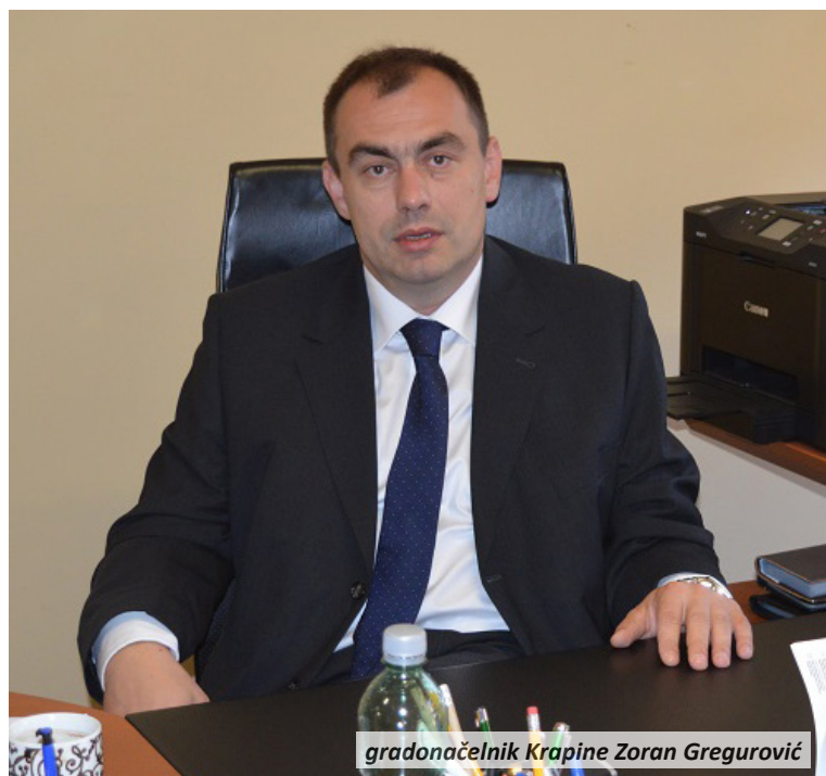
gradonačelnik Krapine Zoran Gregurović

Krapinčani željeli da bude. No, u Gradu Krapini ne odustaju, pa je tako s iznosom nešto većim od dva i pol milijuna kuna i u ovogodišnjem proračunu predviđeno izmještanje ŽCP-a Dolac.