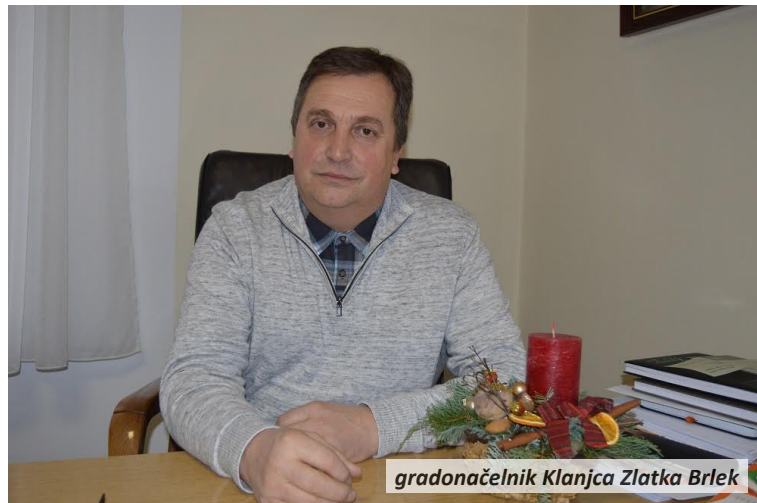
gradonačelnik Klanjca Zlatka Brlek

Analitičari portala Gradonačelnik.hr analizirali su, pak, te podatke prema dohodovnoj metodi i istražili koji su to gradovi u Hrvatskoj koji su najmanje pogođeni siromaštvom i socijalnom isključenosti. Podaci o siromaštvu, prvi put analizirani na detaljnim razinama, trebali bi zatim poslužiti kao pomoć u donošenju politike smanjenja regionalnih razlika i iskorjenjivanja siromaštva i socijalne isključenosti. Brojke ne pokazuju koliko je osoba stvarno siromašno, nego koliko njih ima dohodak ispod