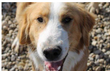
Veno (10 mjeseci)