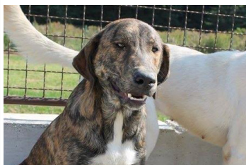
Tigar (1 godina)