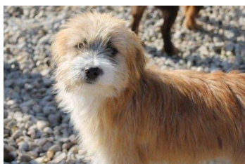
Zita (10 mjeseci)