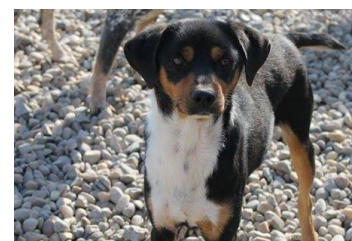
Arno (1 godina)

ju pažnju i vrijeme, a on će vam sasvim sigurno uzvratiti neizmjernom ljubavlju i privrženošću. ■