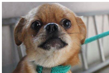
Bigi (1 godina)