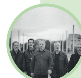
Be Ha Ve