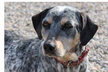
Lota (2 godine)