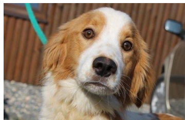
Klark (8 mjeseci)