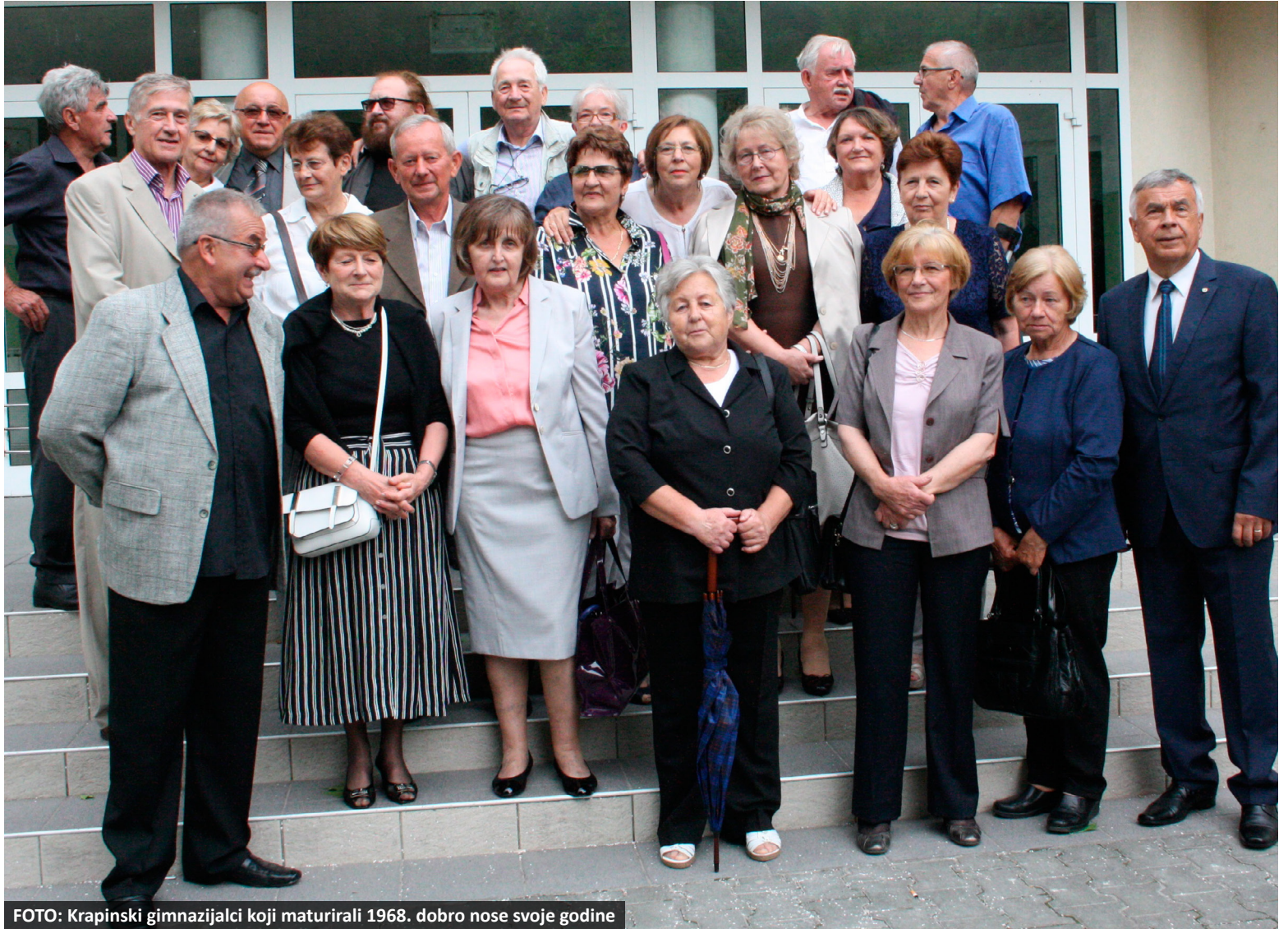
FOTO: Krapinski gimnazijalci koji maturirali 1968. dobro nose svoje godine

Krapinsku Gimnaziju te 1968. godine završilo je njih 58. Bila su to dva gimnazijska razreda: A razred imao je 27 učenika, a u B razredu bilo je dvije trećine muških. No, zbog raznih razloga na jubilarnu, 50. obljetnicu velike mature proteklog vikenda odazvala se polovica njih.