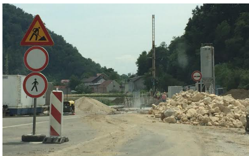
Radovi na magistrali kod Podgore jučer