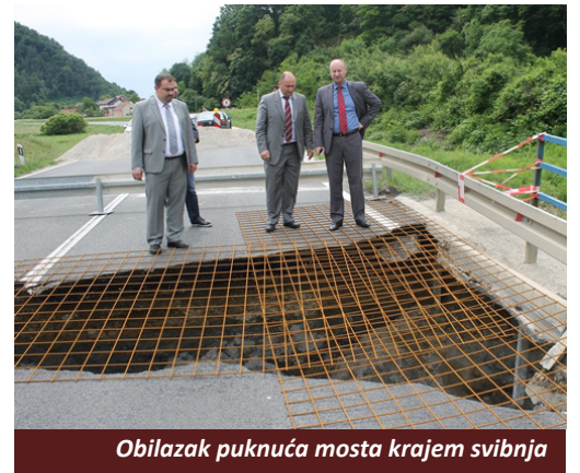
Obilazak puknuća mosta krajem svibnja

provodili terenski i laboratorijski istražni radovi za potrebu izrade projektne dokumentacije sanacije mosta. U prvom redu, riječ je o geomehničkom