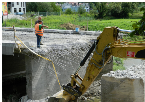
Radovi na mostu 15. srpnja, kada je magistrala trebala biti puštena u promet

biti puštena u promet 15. srpnja. No početak radova se odužio te su oni još u tijeku.