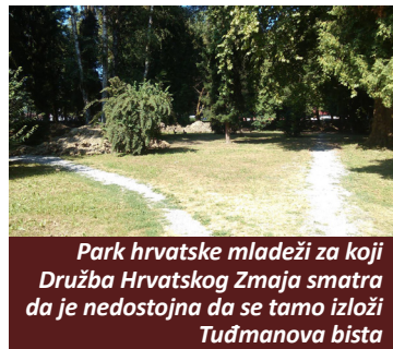
Park hrvatske mladeži za koji Družba Hrvatskog Zmaja smatra da je nedostojna da se tamo izloži Tuđmanova bista

– Istina je da sam bio za inicijativu da se bista dr. Franji Tuđmanu post-