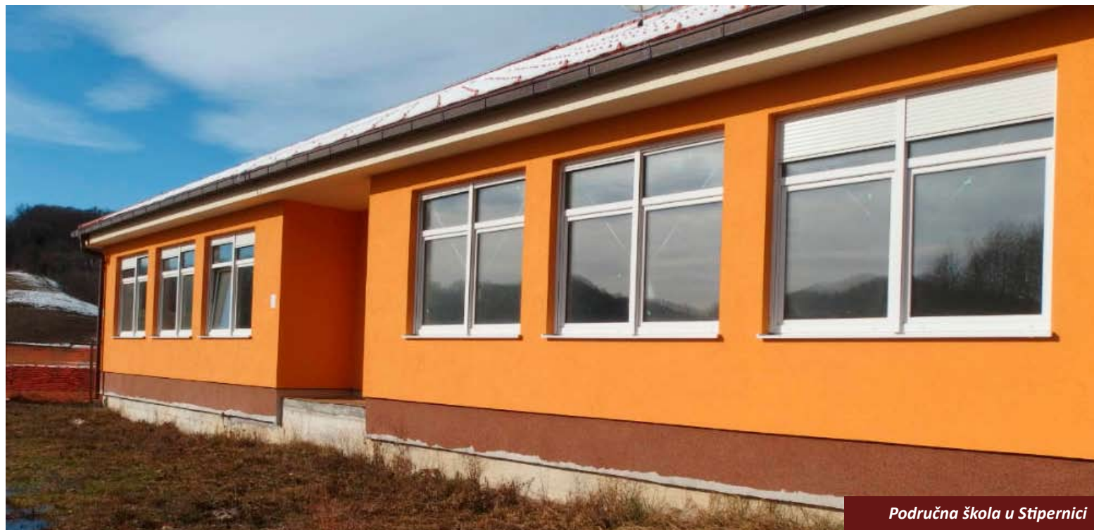
Područna škola u Stipernici