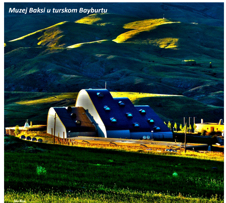
Muzej Baksı u turskom Bayburtu