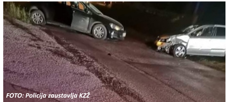
FOTO: Policija zaustavlja KZZ

parkiralištu u Jezeru Klanječkom, do kojeg je došlo uslijed neispravnih električnih instalacija u vozilu. Nastala je materijalna šteta od nekoliko tisuća kuna. Evidentirana su i tri kaznena djela krađe i jedno kazneno djelo oštećenja tuđe stvari. (vc) ■