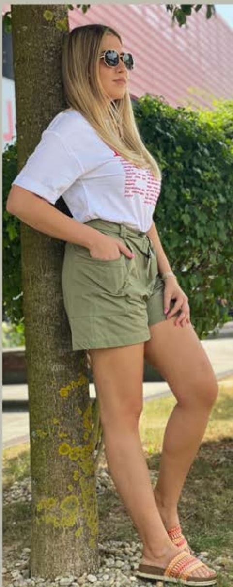
MAJICA RESERVED 39,90 KN; HLAČICE RESERVED 69,90 KN; NATIKAČE MASS 129,90 KN

Ukoliko želiš malo glamurozniji look i imaš malo veći budžet na raspolaganju, dnevnom looku dodaj sunčane naočale Ray-Ban, Optika Anda 1230 kn ili pak naočale za plažu Saint Laurent, Optika Anda 2740 kn. (ZI) ■