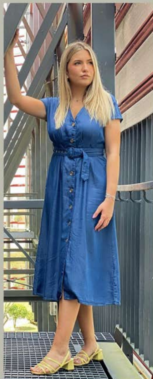
HALJINA MOHITO 179,90 KN; SANDALE SINSAY 49,90 KN