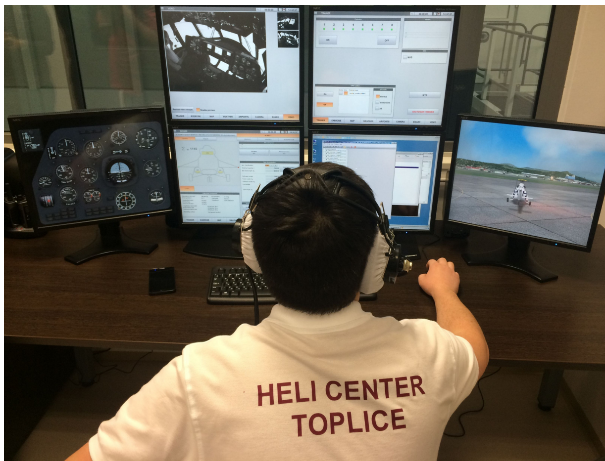
Heli Centar Toplice (slika skroz gore)