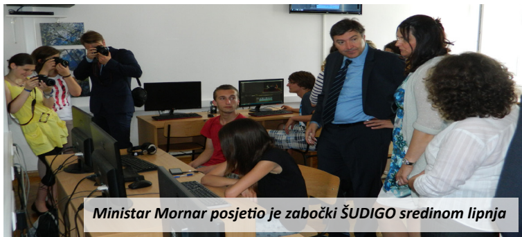
Ministar Mornar posjetio je zabočki ŠUDIGO sredinom lipnja

U Krapinsko – zagorskoj županiji, sa štrajkom je u deset zagorskih sred-