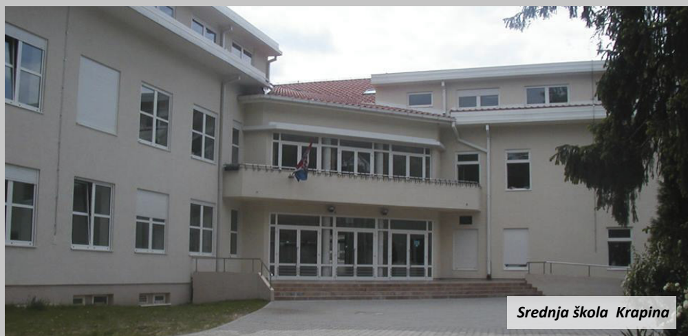
Srednja škola Krapina