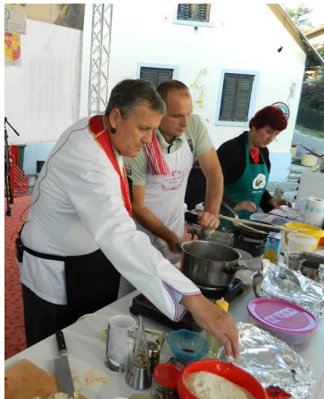
Za sve posjetitelje tu je bio i tradicijski sajam autohtonih domaćih proizvoda, osobito plodova jeseni i to uz

U trodnevnom bogatom i raznovrsnom programu ovogodišnje „Zahvale jeseni“ u Klanjcu, učestvovali su brojni KUD-ovi i udruge s klanječkog područja. U petak navečer otvorena je izložba tradicijske baštine „Iz bakinog ormara“, nakon čega se zabavni program „miksao“ s ugostiteljskom ponudom. Uz to su za subotu i nedjelju organizatori, Grad Klanjec i tamošnja Turistička zajednica, pozivali posjetitelje da „Prošeću klanječkim stoljećima“. Već na ulazu na trg dočekivao ih je notar, izdajući im dozvole boravka u Klanjcu. Kostimirani posjetitelji prošetalu su do trga Antuna Mihanovića, gdje su ih zabavljali dvorski plesači, a za najmlađe bio je priređen i „Rudin drveni vrtuljak“.