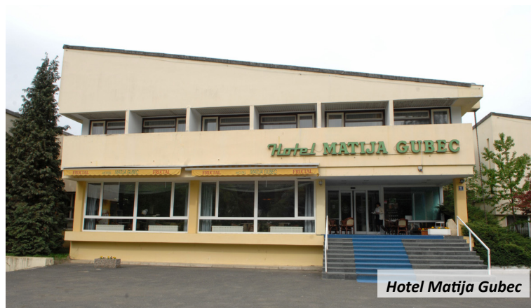
Hotel Matija Gubec

Privatni iznajmljivači najbrojniji su u Krapinskim Toplicama gdje se iznajmljuje 122 kreveta, slijede Tuheljske Toplice, odnosno općina Tuhelj sa 77 kreveta, Marija Bistrica ima 45 kreveta, Donja Stubica 22, Krapina 17, Radoboj 16, Veliko Trgovišće 12, Stubičke Toplice i Gornja Stubica po deset, Đurmanec osam, Gornje Jesenje, Sveti Križ Začretje i Mihovljan četiri te Bedekovčina i Hrašćina dva ležaja. Ostali gradovi i općine nemaju nijedan registrirani privatni ležaj. (mlm)