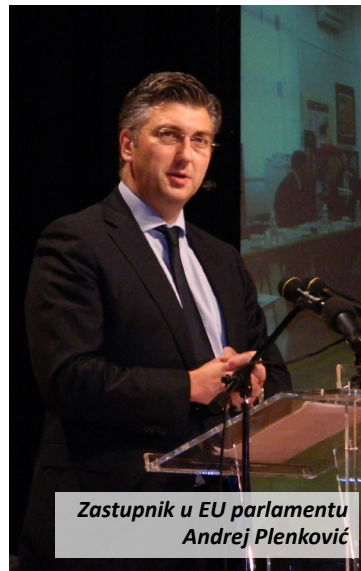
Zastupnik u EU parlamentu Andrej Plenковиć

zacije - optike. Do sad je u Ulici M. Gupca i Magistratskoj ulici napravljena sva komunalna infrastruktura, a u Ulici M. Gupca bit će još postavljena i nova rasvjeta. Do kraja godine te bi dvije ulice trebale biti gotove s riješenim nogostupima i prvim slojem asfalta na kolniku, objasnio je gradonačelnik, dodajući da bi se do proljeća trebala riješiti komunalna infrastruktura i u Gajevoj ulici i Trgu Lj. Gaja. Završni sloj asfalta planira se na cijeloj dionici po završetku tih radova, a uređenju samog Trga prišlo bi se u proljeće 2016. godine.