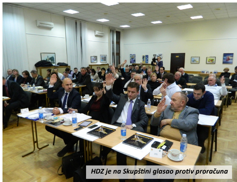
HDZ je na Skupštini glasao protiv proračuna

rekao je kako oni ne mogu prihvatiti ovaj proračun zbog političke nevjerođostojnosti SDP-a, koji iz dana u dan govori kako Zagorje ima najbolje gospodarske pokazatelje u Hrvatskoj, međutim ovakav smanjeni proračun u tome ih demantira.